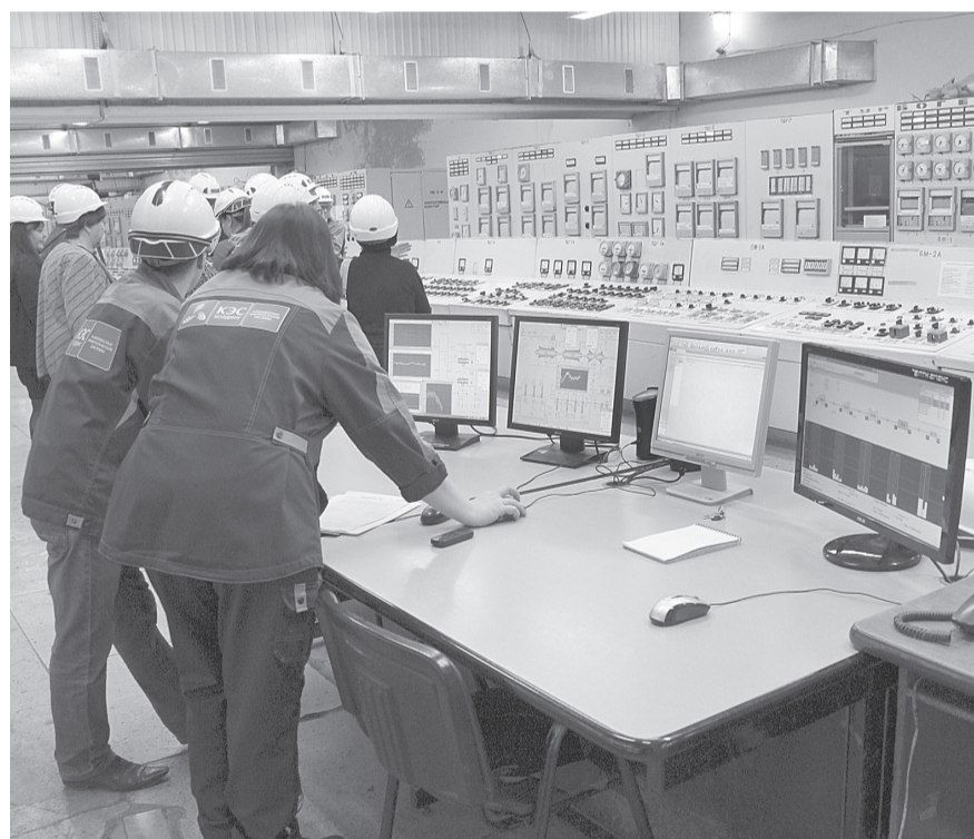
ТЭЦ-1, на территории которой состоялось очередное заседание областного координационного совета собственников в ЖКХ, обслуживает сегодня большую часть правобережья Ульяновска. Электрическая мощность ТЭЦ составляет 435 МВт, тепловая мощность - 2014 Гкал/ч. Годовая выработка электричества - 1610,54 млн кВт/ч.

- Появление нового омбудсмена призвано не только поднять на более высокий уровень общественный контроль, но и привлечь жителей к совместной отладке функционирования сферы ЖКХ, - резюмировал Сергей Морозов.